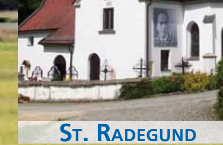
ST. GEORGEN BEI SALZBURG